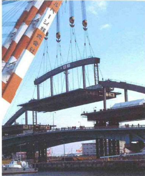
上部工の大ブロック架設